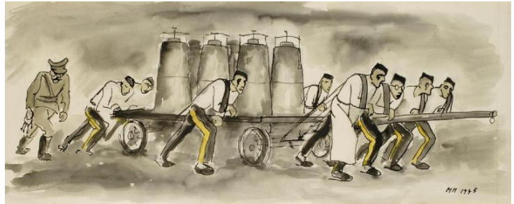
Muži táhnoucí vůz, Waldheim

21. dubna 1945 je od půlnoci ve spánku rušila dělostřelba, která trvala až do rána. V neděli 22. dubna dostali pouze 1l bramborové polévky. V pondělí 23. dubna ¾ l brambor na loupačku a ¼ l rozvařených kvaků. V úterý 24. dubna ¾ l brambor na loupačku a 2 lžíce sádla. Ve středu 25. dubna ¾ l brambor na loupačku a ¼ l řídkého kyselého zelí. Ve čtvrtek 26. dubna ¾ l brambor na loupačku a ¼ l řídké kvaky. Téhož dne byly vyvolání a otázky, kam který chce jít. Jaroslav Hořínek řekl do Jihlavy.