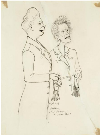
"Frau Verwalterin" a "Unsere Frau" Waldheim 1945

V dubnu 1945 se opět nachází na Waldheimské půdě. Ke snídani zde mají ½ l kávy a 150g chleba. K obědu 1l řídké bramborové polévky. K večeři ½ l kávy, 150g chleba, 15g vuřtu a 15g margarínu. Občas zde dostanou 15g marmelády, umělého medu, syrového masa a taveného sádla. K večeři někdy mívají i posolený chléb se syrovým masem, cibulí a česnekem.