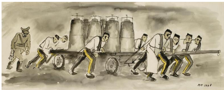
Muži táhnoucí vůz, Waldheim

21. dubna 1945 je od půlnoci ve spánku rušila dělostřelba, která trvala až do rána. V neděli 22. dubna dostali pouze 1l bramborové polévky. V pondělí 23. dubna ¾ l brambor na loupačku a ¼ l rozvařených kvaků. V úterý 24. dubna ¾ l brambor na loupačku a 2 lžíce sádla. Ve středu 25. dubna ¾ l brambor na loupačku a ¼ l řídkého kyselého zelí. Ve čtvrtek 26. dubna ¾ l brambor na loupačku a ¼ l řídké kvaky. Téhož dne byly vyvolání a otázky, kam který chce jít. Jaroslav Hořínek řekl do Jihlavy.