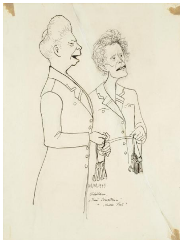
"Frau Verwalterin" a "Unsere Frau" Waldheim 1945

V dubnu 1945 se opět nachází na Waldheimské půdě. Ke snídani zde mají ½ l kávy a 150g chleba. K obědu 1l řídké bramborové polévky. K večeři ½ l kávy, 150g chleba, 15g vuřtu a 15g margarínu. Občas zde dostanou 15g marmelády, umělého medu, syrového masa a taveného sádla. K večeři někdy mívají i posolený chléb se syrovým masem, cibulí a česnekem.